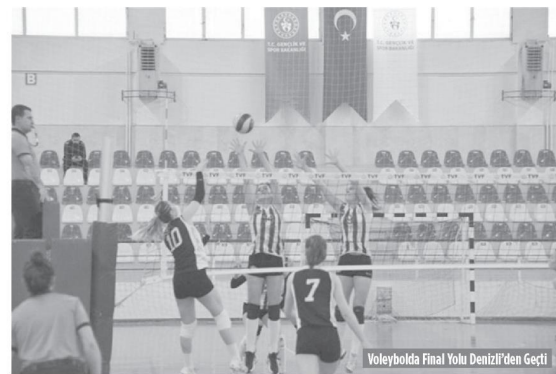
Voleybolda Final Yolu Denizli'den Geçti

Türkiyede İlk Kezaveinde Korfing Oynandı Adalet Bakanlığı ile Gençlik ve Spor Bakanlığı arasında imzalanan işbirliği protokolü çerçevesinde Çal Gençlik ve Spor İlçe Müdürlüğü, Denizli D Tipi Kapalı Ceza İnfaz Kurumu'nda tutuklu bu-