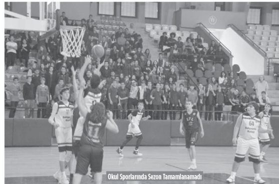
Okul Sporlarında Sezon Tamamlanmadı