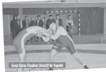
Grup Güreş Finaletleri Denizli'de Yapıldı