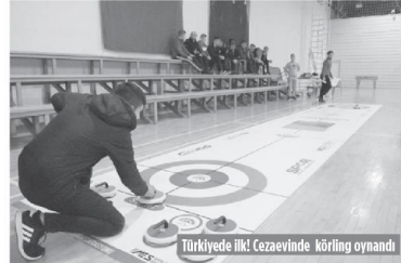
Türkiyede İlk Kezaveinde Korfing oynandı

vatandaşlarımızı karantina sürecinde ağırlayan öğrenci yurtlarımızın sadece gençlerimizin değil, bütün milletimizin yuvası oldu"