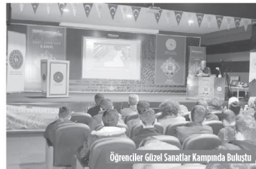
Öğrenciler Güzel Sanatlar Kampında Buluştu