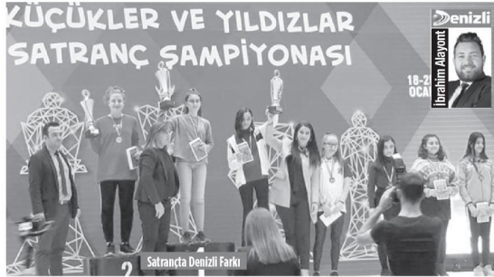
Satrançta Denizli Farkı