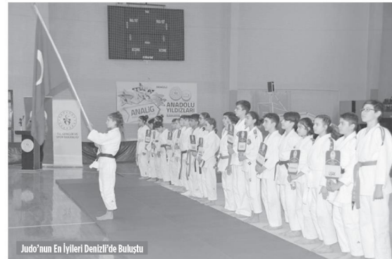
Judo'nun En İyiileri Denizli'de Buluştu

lan çocuk ve gençler arasında "Floor Korfing" turnuvası düzenledi. Denizli Ceza İnfaz Kurumu'ndaki gençlerin kişisel gelişimleri ve sosyal